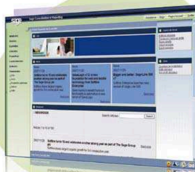
Sur le portail de Sage FRP Consolidation et Reporting, vous accédez à des informations externes à l'application.