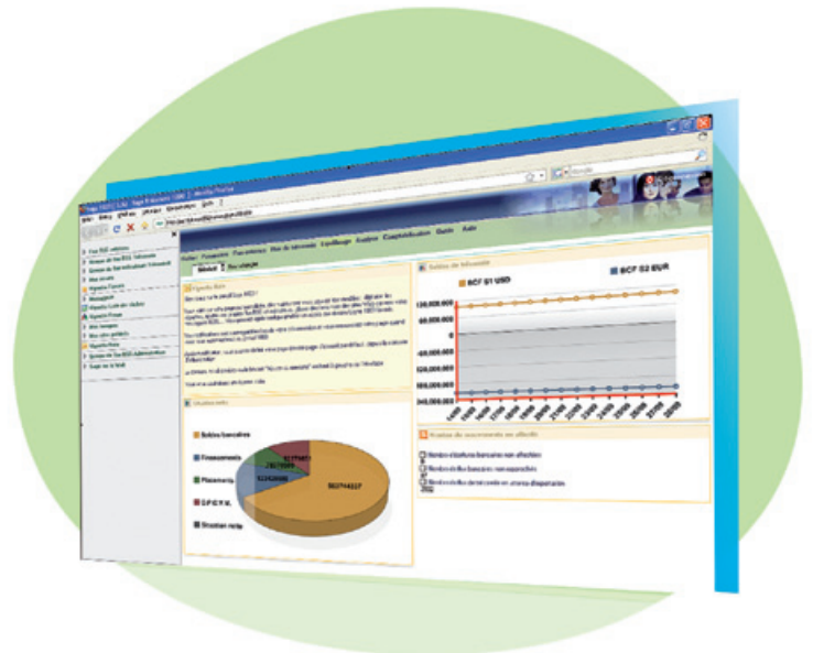
Un portail financier Web 2.0 : "situation nette" et "solde de trésorerie"