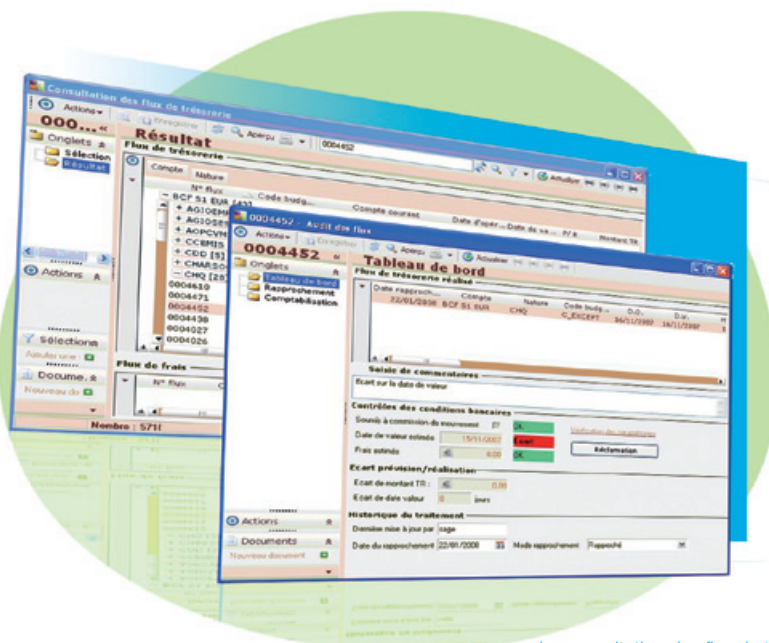
La consultation des flux de trésorerie s'ouvre sur un audit de flux